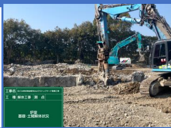
炉室 土間、基礎解体