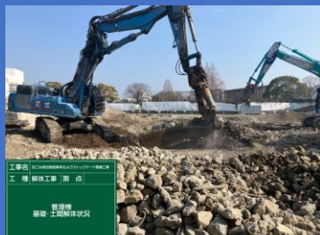
管理棟 土間、基礎解体