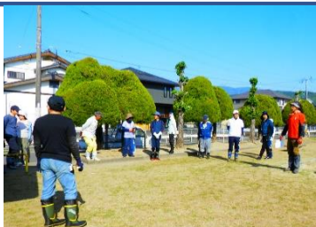
朝のミーティング風景

萱方町では今年度最初の町内イベント「萱方川の大掃除」が行われました。萱方町を南北に貫く水路(通称：萱方川)の大掃除のため、日曜日の早朝から93人の住民の方々が集まりました。上組・中組・下組の3手に分かれミーティングの後、約2時間かけて大掃除をしました。川ざらえは美観維持や環境保護以外にも防災やまちづくりに一役かっています。