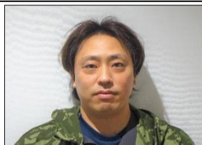
柳 区 松枝 吏視