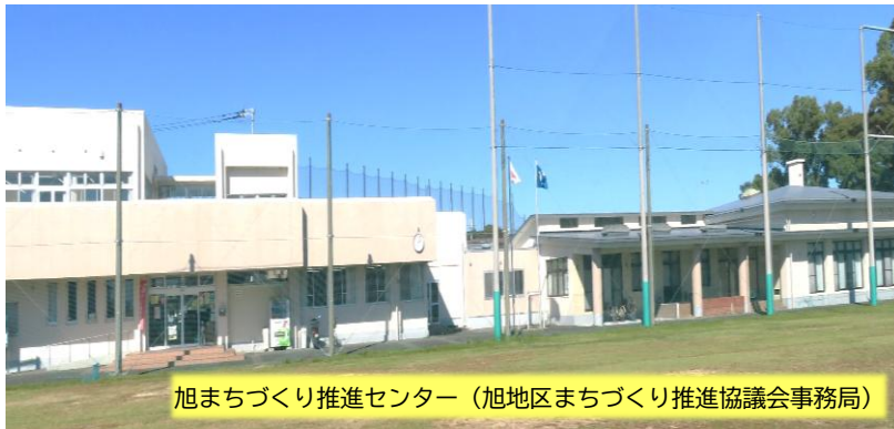
旭まちづくり推進センター (旭地区まちづくり推進協議会事務局)

また、旭地区には古くから人が住みつき、約3000年前の集落や、約2000年前の遺跡等多くの文化財も見つかっています。地区内には長崎街道や、「佐賀の乱」等多くの歴史の舞台となった朝日山があり、長い歴史を刻んできました。工業も盛んになり、34号線沿いに工場も誘致されました。2029年には、アサヒビール鳥栖工場が操業開始予定です。時代と共に旭地区の風景も変わりつつありますが、村田浮立など地域の祭りや 伝統文化 を受け継ぎながら 人の絆を大切に し、若い世代から高齢の方まで 元気な笑顔と思いやりの心でつながる住みよいまちづくり を目指しています。