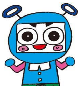
「ワアちゃん」 輪を作るお手伝い！