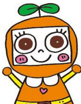
「メイちゃん」 芽をだすお手伝い！