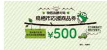
▲鳥栖市応援商品券(500円券)