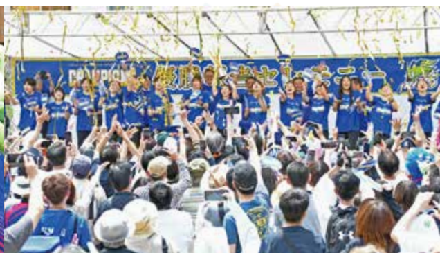
中央公園でのセレモニーの様子