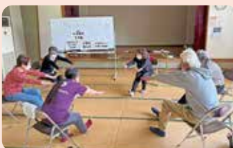
▲元気カフェの様子