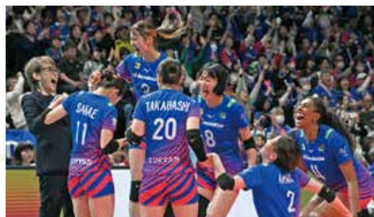
PFU戦に勝利し喜ぶ選手たち

2025-26シーズン、本当にたくさんのご声援ありがとうございました。これからもSAGA久光スプリングスへの応援をよろしくお願いいたします。(記事・地域おこし協力隊員)