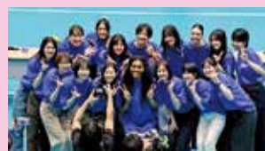
笑顔で記念撮影する選手たち