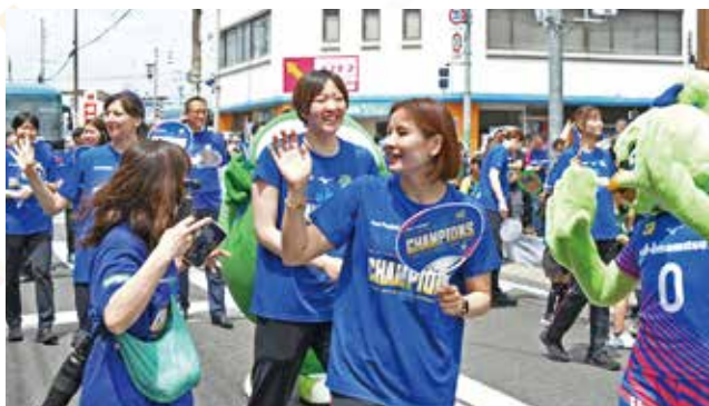
集まったファンに手を振りながら歩く選手たち

5月24日(日)、鳥栖本通筋商店街でSAGA久光Springsの優勝祝賀パレードを開催しました。選手たちは本町交差点付近から出発し、JR鳥栖駅方面へ約300m歩いた後、中央公園で優勝報告セレモニーを実施。セレモニーでは選手一人一人からシーズンの振り返りや感謝の言葉、来シーズンへの意気込みなどが語られました。沿道や中央公園を埋め尽くすほど多くのファンが駆け付け、選手らとともに優勝の喜びを分かち合いました。