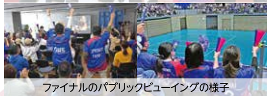
ファイナルのパブリックビューイングの様子