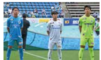
2026/27シーズンユニフォーム

8月に開幕するJ2リーグでJ1昇格へ向けて再スタートするサガン鳥栖へ、熱い応援をよろしくお願いします。(第18節終了時点)