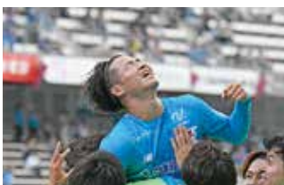
ゴールを決めて喜ぶ芳野選手

翌日の試合結果により、サガン鳥栖は地域リーグ3位でプレーオフラウンドへ臨むこととなりました。