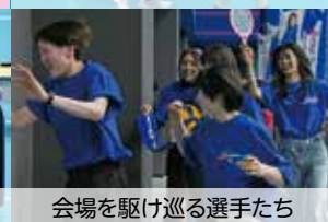
会場を駆け巡る選手たち