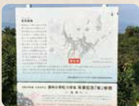
▲吉見岳城跡 (久留米市) 高良山には何カ所か山城があり、大友軍はこれらに駐留していたと推測される

同年9月、北野(久留米市)にて大友方の総大将立花道雪が亡くなります。時を同じくして、筑紫広門が宝満山城(太宰府市・筑紫野市)を攻略します。大將を亡くし、退路を失った大友軍は崩壊、筑後地方を舞台とした大友家との戦いは終わりを告げました。 (鳥栖市誌第3巻第3章より)