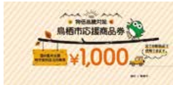
▲鳥栖市応援商品券(1,000円券)