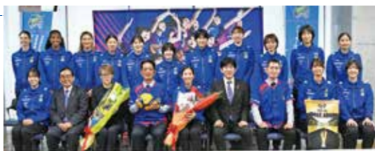
2025-26 大同生命 SVLEAGUE SAGA久光Springs 記念旗 ホームタウンシーズン終了報告