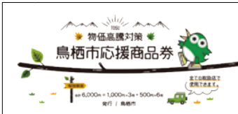
▲鳥栖市応援商品券冊子表紙