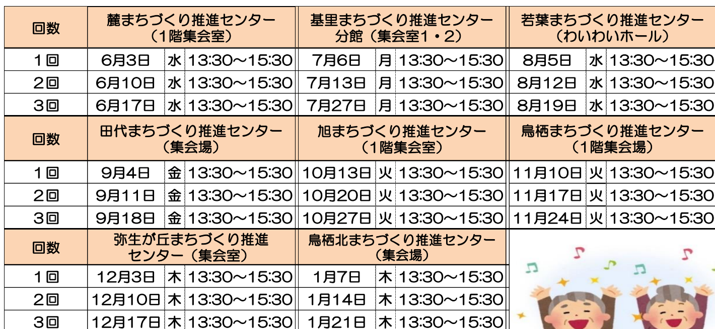
【令和 8 年度 音楽サロン 各地区まちづくり推進センター 日程表】