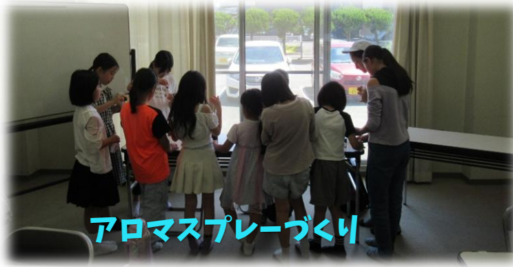
アロマスプレーづくり