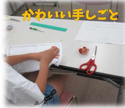
かわいい手しごと