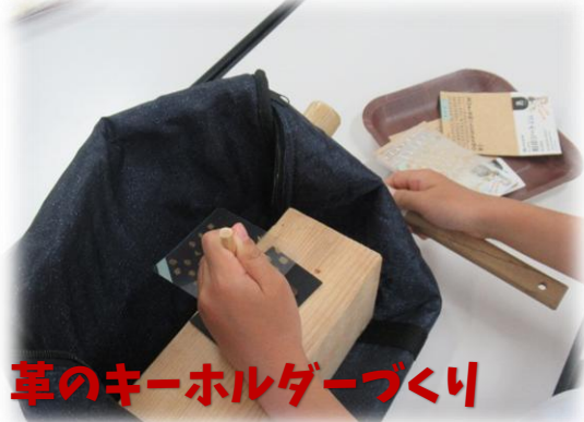
革のキーホルダーづくり