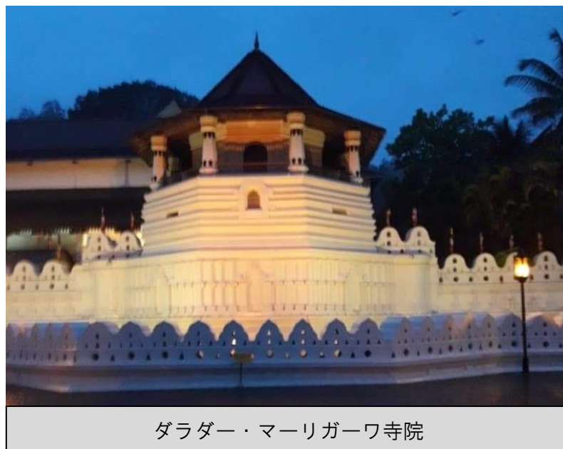
ダラダー・マーリガーワ寺院

私はこれからも日本で勉強を続け、最終的には自分の会社を作りたいと考えています。そして、日本とスリランカの交流に貢献したいと考えています。