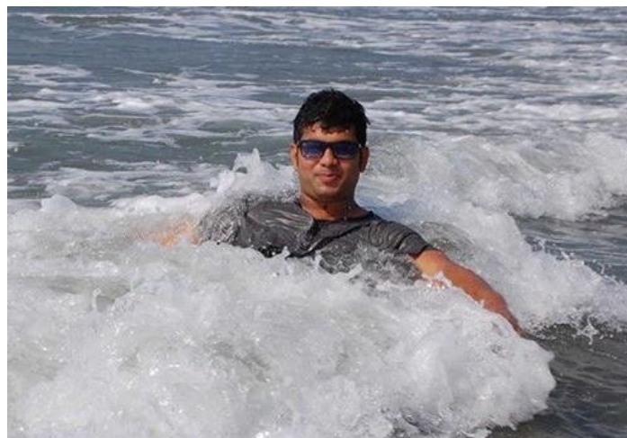
コックスバザールで海水浴

鳥栖に住んで1年がたちますが、鳥栖の人はみんな親切で、とても住みやすいまちだと思います。道にゴミは落ちていないし、必ず信号を守って生活しています。日本人は、自分の都合ばかり考えないで、周りの人、環境のことを考えて生活していると思います。私の国では、小さい町でも大きい町でもゴミがどこでも落ちていますし、信号もあまり見ていません。私は今、弘堂国際学園のボランティアで学校の周りや駅の周辺を清掃しています。ゴミを拾って、きれいにすることは大変です。きれいで住みやすいまちをつくるためには気持ちを育てることが大切だと日本に来て勉強しました。今、私は学校から畑を借りて、野菜を植えています。できる野菜は少ないですが、日本の人にあげて、喜ばれると、私もうれしいです。