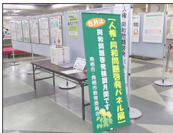
人権・同和問題啓発パネル展