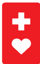
ヘルプマーク (資料P5)