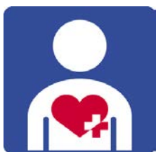
ハートプラスマーク (資料P4)