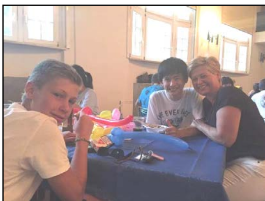
【ツァイツ市を訪問】