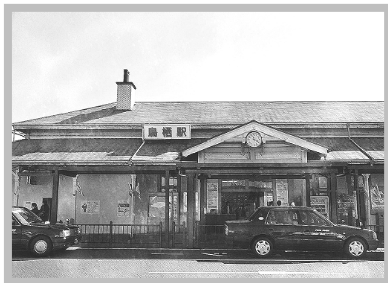
鳥 栖 駅

また、この基本方針は、人権が尊重される社会づくりの担い手は市民であるとの認識の下に、市民、団体、事業者、行政などがそれぞれの役割を踏まえた上で連携、協働しながら人権教育・啓発を推進するものです。