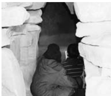
石室内部を見られる貴重な機会

市教育委員会は、国史跡の田代太田古墳(田代本町)と市重要文化財のヒヤーガンサン古墳(弥生が丘)の