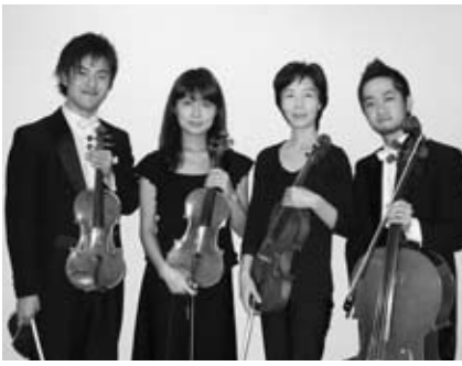
日フィルの演奏をお楽しみください

チケット料金 ● 全席自由 3000円(学生以下は1000円) チケット発売日 ● 11月20日(土)