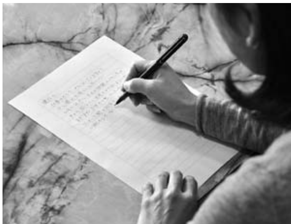
新成人へのメッセージをお寄せください

申し込み ● 11月30日(火)までに所定の応募用紙に①氏名②新成人との続柄③電話番号④新成人の氏名⑤公開の可否(可の場合、当日プログラムなどへ掲載する場合があります)を明記し、生涯学習課(〒841-8511 鳥栖市宿町11