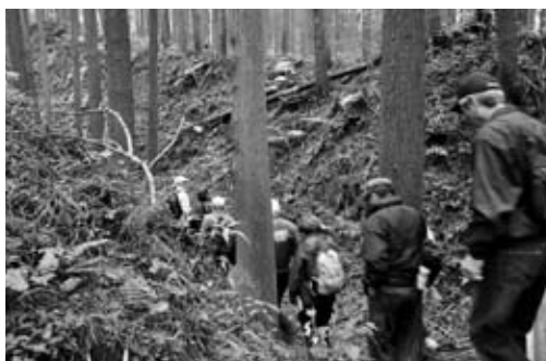
特徴的なV字型の空堀を歩きます

今回は、勝尾城の支城である葛籠(つづら)城跡を中心にして、戦国時代の空堀など、当時がしのばれる遺跡を散策しながら見学します。約2時間30分ほどのコースをボランティアガイド(ふるさと元氣塾)が誘導案内します。