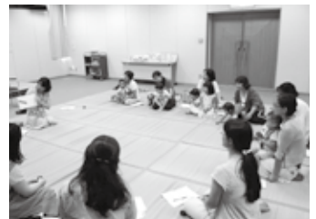
子どもと一緒に楽しく参加できます

8日(水)までに市立図書館(〒841-0053鳥栖市布津原町11-21 FAX84-2828)へ電話もしくは申込用紙を郵送、FAXまたは持参してください。申込用紙は図書館で配布するほか、ホームページ( http://www.library-tosu.jp )からもダウンロードできます