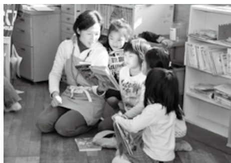
子どもたちが安心して過ごせます

応募資格 ●住所、資格は問いませんが、保育士、幼稚園・小学校教諭の資格を持つ人または学童保育指導員実務経験者などを優先 募集人員 ●若干名 勤務日 ●月曜日から土曜日のうち週5日程度 勤務時間 ●シフト制、勤務時間帯はお尋ねください。平日●午後うちの3～5