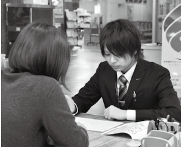
20歳の彼も国民年金