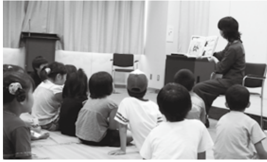
子どもの笑顔を引き出すおはなしをしましょう

対象 ●市内の学校でおはなしボランティアとして活動中または活動したい人 3日間とも受講できる人 とき ●2月15日・22日、3月1日（いずれも火曜日）10時10分～12時 ところ ●市立図書館 内容 ●おはなし会の実際と学校での読み聞かせの大切さについての講義、受講者による絵本の読み聞かせ実習、おはなしボランティアグループの情報交換会