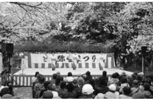
今年の舞台は新鳥栖駅を臨みます