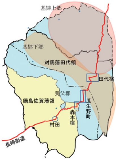
江戸時代の領内イメージ図

と呼び、それぞれに別当・座親を置いて上納金の徴収などに当たりました。一方、鍋島領は「藩中、藩あり」といわれるほど構成が複雑で、藩に年貢が入る蔵入地と家臣に年貢が入る知行地が分散して