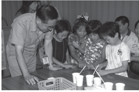
楽しい実験がいっぱい

産業技術総合研究所九州センターでは、研究室や実験室を一般公開します。入場無料。科学の楽しさ、作る喜びを体験しませんか。