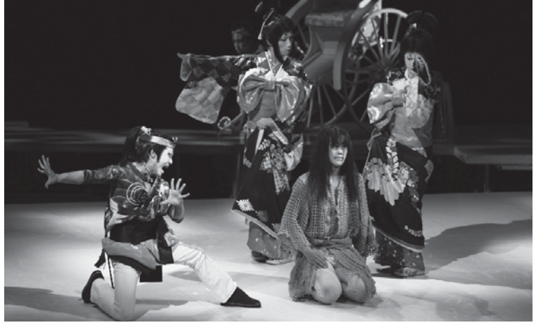
「ジーザス・クライスト=スーパースター」の一場面