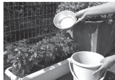
水の再利用にチャレンジしましょう

風呂の残り湯を洗濯やトイレの流し水に使ったり、雨水をタンクなどに貯めて植木の水やりや洗車などに使ったりするなど、水の再利用にチャレンジしましょう。