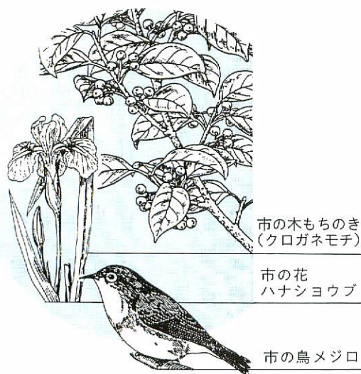
市の木もちのき (クロガネモチ)