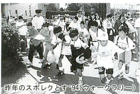
昨年(ウオーグラリー)とす'94のスポレク

親しみやすいスポーツを通して市民の交流を深める「第五回鳥栖市スポーツ・レクリエーション祭(スポレクとす'95)」を十月一日(日)市民公園一帯で開催。当日は、開会式を午前八時半から市民球場で行ったあと、同九時半から各競技が一斉にスタートします。参加を希望する方は申込書を添えて九月十四日までに教育委員会社会体育課(☎3