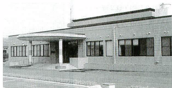
▶昨年八月にオープンした勤労者総合福祉センター

利用申し込みや施設へのお問い合わせは直接、同センター（曾根崎町 ☎5165）へ。