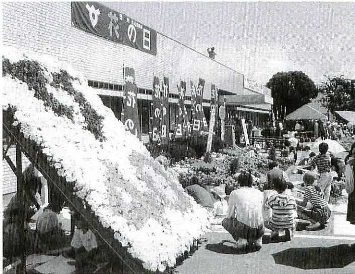
花いっぱい彩られた会場 (昨年の花の日)

第七回「花の日」の催しを五月二十八日(日)午前十時から午後二時まで、市役所前広場と市役所市民ホールで開きます。