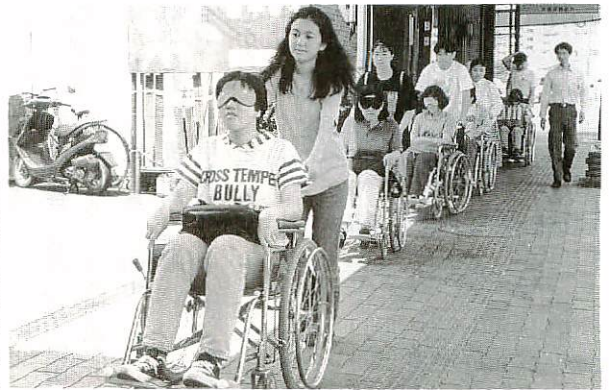
アイマスクをつけての車いす体験（昨年のふれあい広場）

社会福祉協議会では「第九回ふれあい広場」を六月四日（日）午前十時から午後三時まで、ふれあいセンター（社会