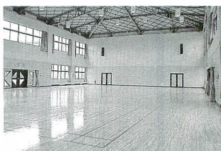
◀軽スポーツに利用できる体育室

また、教養文化室は三十畳の和室で、華道、茶道、着付けなどの講習会に利用できます。情報展示コーナーでは、職業訓練の案内や雇用促進のための就職情報も提供しています。センターはどなたでも利用できます。利用時間は午前九時から午後十時まで。利用料金は時間帯などで多少異なりますが、雇用保険の被保険者またはかつて被保険者であった方であれば、会議室、研修室、教養文化室は一時間当たり二百円から四百円程度、体