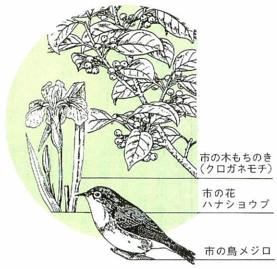
市の木もちのき(クロガネモチ)