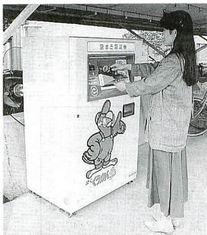
市民に好評の空き缶回収機「くうかん鳥」

市では、空き缶の散乱防止と資源再利用、環境問題に対する市民への啓発活動の一環として、空き缶回収機