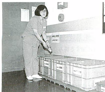
古紙・廃棄物の分別回収を徹底

ては、包装重量の減量化、 消費電力低減に努めるな ど、環境対策委員会と廃 棄物・省エネルギー・環 境保全・商品環境の四専 門分科会により組織をあ げて環境問題に取り組ん でいます。