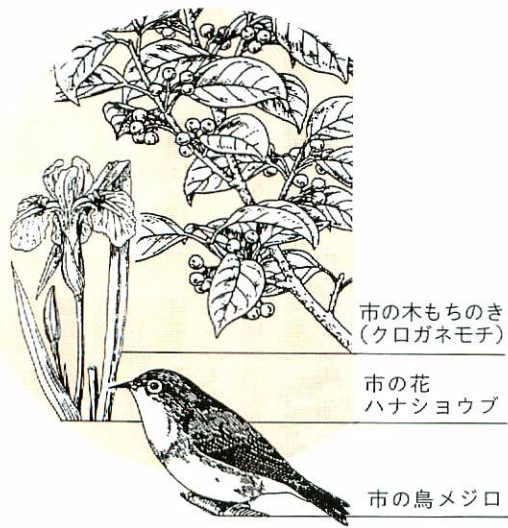
市の木もちのき (クロガネモチ)