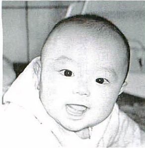
有家政博さん由紀さんの長男