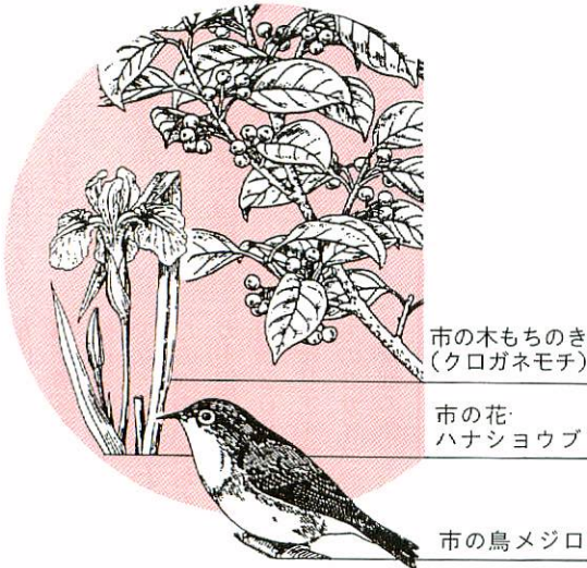
市の木もちのき (クロガネモチ)