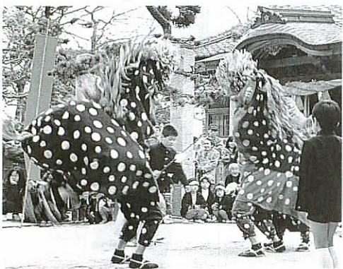
悪魔払いや豊作祈願の曾根崎獅子舞

終戦後、途絶えていましたが、昭和五十九年に復活。同六十二年には市重要無形民俗文化財に指定され、毎年三月に曾根崎町で公開されています。