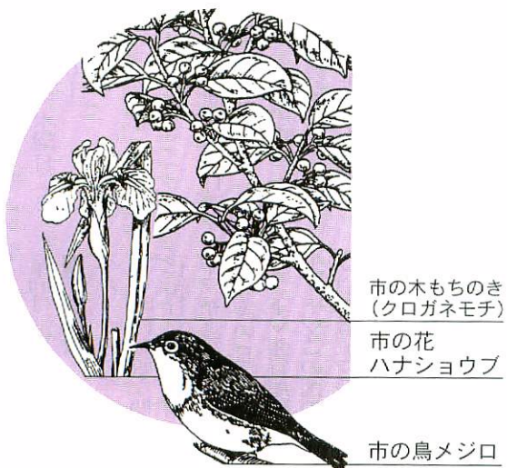
市の木もちのき (クロガネモチ)