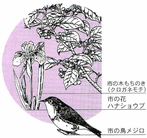
市の木もちのき(クログネモチ) 市の花 ハナショウブ 市の鳥メジロ