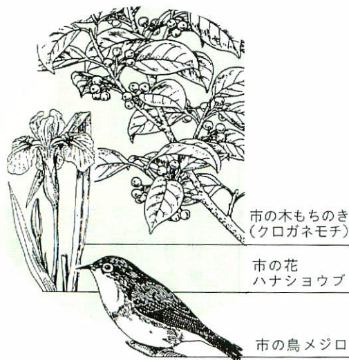
市の木もちのき (クロガネモチ)