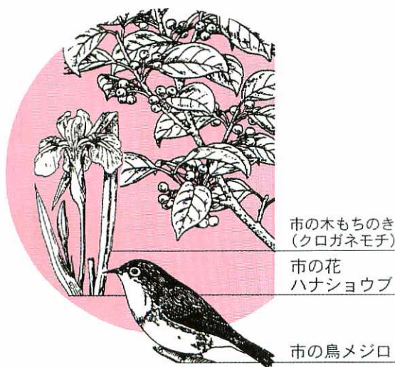
市の木もちのき（クロガネモチ）