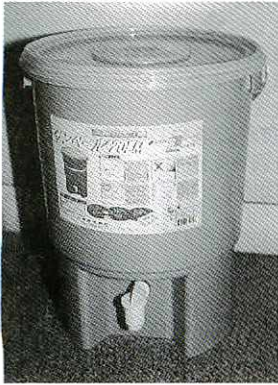
生ごみ密封発酵容器・サンペール

生ごみの減量化と再利用を進めるため、市では家庭から出る生ごみを自家処理して園芸用の堆肥をつくる生ごみ堆