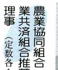
前間 清利 (47歳、姫方町)