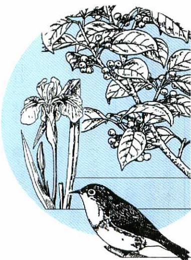
市の木もちのき(クロガネモチ)

参加資格 ● 二十歳以上の男女 ※なお、同レクリエーション祭は十一月十四日(日)に小郡市で開かれます。