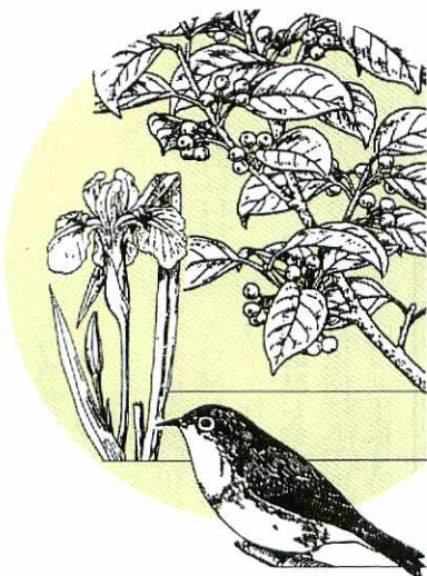
市の木もちのき（クログネモチ）