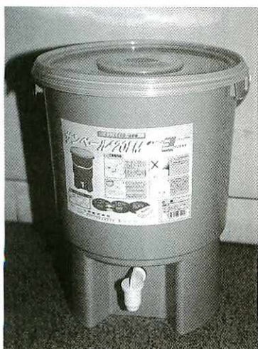
生ごみ密封発酵容器・サンペール

生ごみの減量化と再利用を進めるため、市では家庭から出る生ごみを自家処理して園芸用の堆肥をつくる生ごみ堆肥化処理容器（コンポスター）とEM菌を活用する生ごみ密封発酵容器（サンペール）を購入する方に、あつせん価格の半額を補助します。