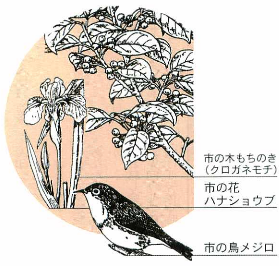
市の木もちのき(クロガネモチ) 市の花 ハナショウブ 市の鳥メジロ