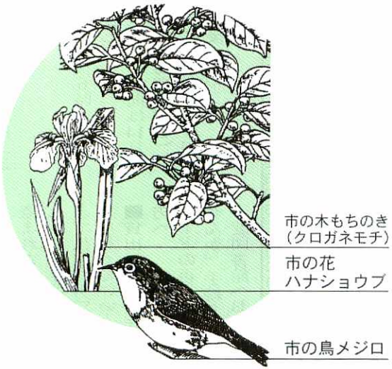
市の木もちのき (クロガネモチ)

平成10年度末で新たに左の図のとおり加藤田町、蔵上町、曾根崎町など一六〇・九haで下水道が利用できるようになりました。多くの経費を投じて整備された下水道の効果を發揮するため、できるだけ速やかに水酸化工事をされるようお願いいたします。また、市民のみなさんには下水道工事などでご迷惑をおかけしますが、ご協力いただきますようお願いいたします。詳しくは下水道課(☎3542)へ。