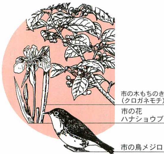
市の木もちのき(クログネモチ) 市の花 ハナショウブ 市の鳥メジロ