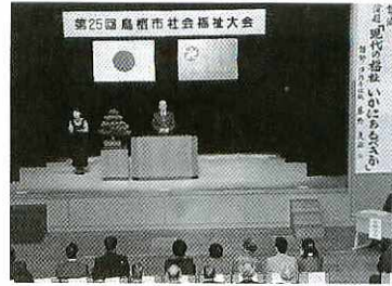
サンメッセで開かれた式典

員・児童委員などの関係者約240人が出席。地域福祉の充実を目指し、意識の高揚と連帯を深めました。