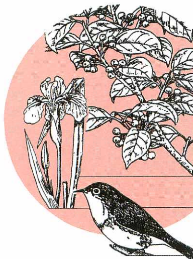
市の木もちのき (クロガネモチ)

鳥栖市管工事協同組合 ☎84-2500 ●水道の修繕はすべて上記へお申し込みください