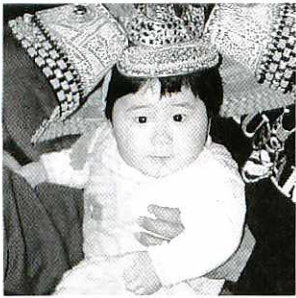
松本学さんゆかりさんの長男