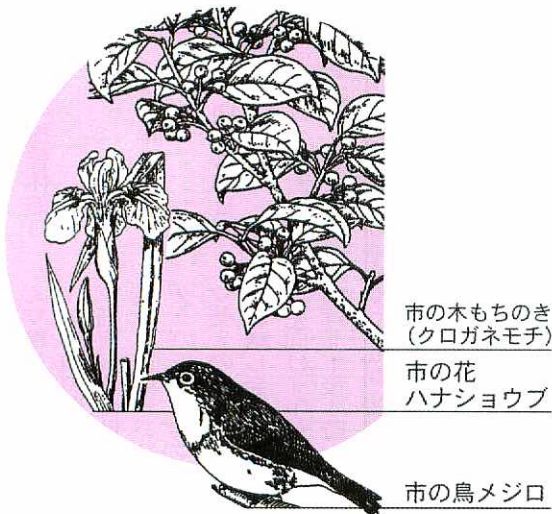
市の木もちのき(クロガネモチ)