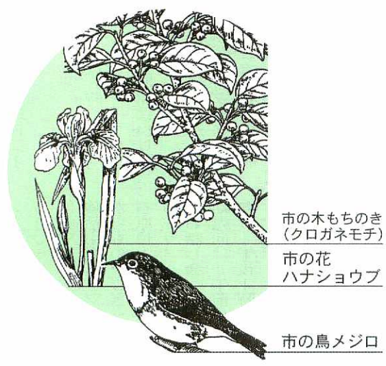
市の木もちのき (クロガネモチ)