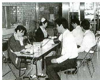
献血の呼びかけに応じる市民

鳥栖養基ライオンズクラブ の会員など約20人が4月20 日、市役所で献血を市民に呼