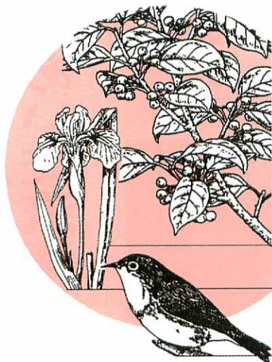
市の木もちのき(クログネモチ)

鳥栖市管工事協同組合 ☎84-2500 ●水道の修繕はすべて上記へお申し込みください