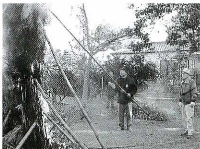
燃え上がる竹のやぐらを見つめる下野園の園児ら

また、一月六日に下野町老松宮で行われた「ほっけんぎょう」には、老人会と保育所下野園の園児約三十人が参加。老人会のメンバーが、竹やかずらなどで作った六メートルのやぐらに点火すると、竹は「ボン、