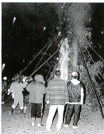
夜明け前、牛原町で行われたほんげんぎょう

正月の伝統行事「ほんげんぎょう」が、牛原町と下野町で行われました。ほんげんぎょうは、竹で組んだやぐらを燃やして一年の健康を祈願する伝統行事です。所によっては「鬼火たき」「どんど焼き」「ほっけんぎょう」などと呼ばれています。