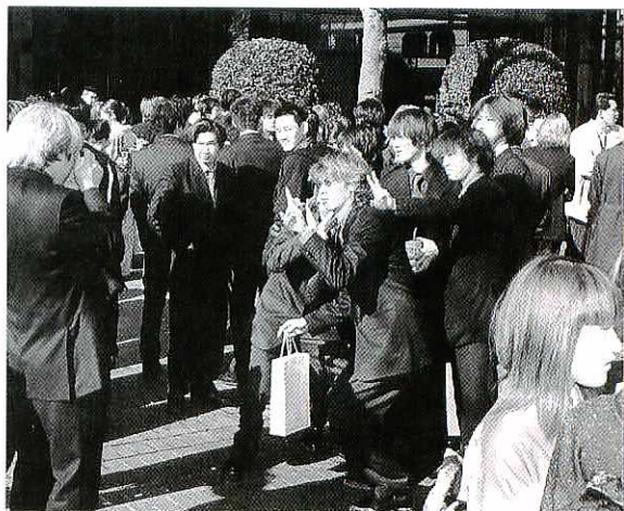
級友との再会を喜び、記念写真に収まる新成人