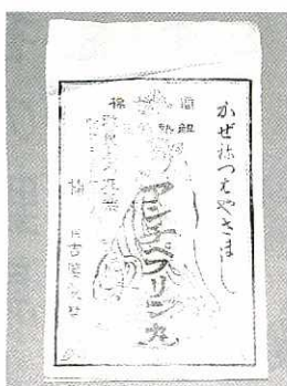
アンチペプリン丸(中富記念くすり博物館収蔵品)