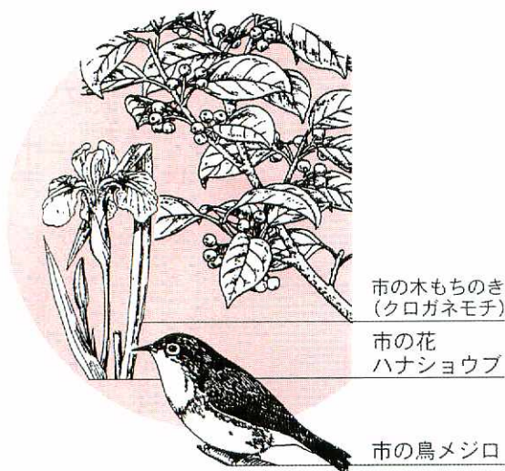
市の木もちのき (クロガネモチ)