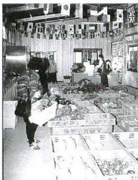
新鮮な野菜が並ぶ直売所

などが並んでいます。これらはJA鳥栖基山農産物直売所出荷者協議会(会員百四十人)の会員が収穫、製造したもので、値段は「ほとんどが百円前後です」。 「スーパーは、卸市場などの関係で外国産や県外産のものが多いですね。ここでは地元の新鮮な野菜を低価格で販売しています」と同農協の築地経済部長。 値札は生産者が付けており、価格のほかに生産者名も記載。客の中には生産者にこだわる人もおり、希望すれば直接、生