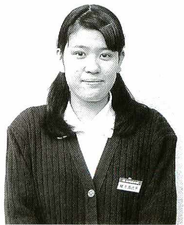
(株)村岡総本舗鳥栖店勤務

私は平成十二年四月に入社し、販売を担当。お客様に対しては、いつも感謝の気持ちを忘れず、笑顔で接するよう心がけています。 趣味は音楽鑑賞と読書で、休日はショッピングを楽しんでいます。 みんながゆつくり休めるような温泉が市内にあるといいですね。