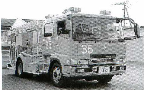
鳥栖消防署に配備された大型の化学消防ポンプ車

石油類などの危険物火災に対応しようと、鳥栖・三養基地区消防事務組合は十二月二十日、大型の化学消防ポンプ自動車を購入。鳥栖消防署に配備し、一月四日から運用しています。新しく導入した化学消防ポンプ車は、総重量約十四トンのオートマチック車。長さ八・二五m、幅約二・四九m、高さ三・二mで、乗車定員七人。化学消火薬剤五百リットルと水三千リットルを積載しています。