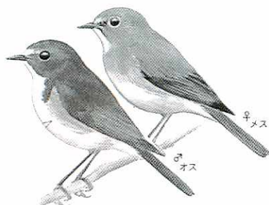
警戒心が弱く観察が容易なルリビタキ

ルリビタキは、オスの頭から背中にかけて青色(瑠璃色)をしているので、この名前が付けられました。スズメくらい(十四cmほど)の体長で、頭から背中にかけての青色