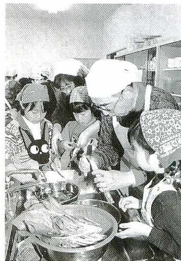
祖父母からゴボウの切り方を習う子どもたち

い一日にしましょう」とあいさつ。保健婦は「旬の野菜を多くとり、朝ご飯は必ず食べましょう」などと健康な食生活をアドバイスしました。この日のメニューは、「牛肉ずし」「カニクリーム茶巾」「かき卵汁」「スイートポテト」「ほうれん草のごまあえ」の五品。参加者は栄養士の説明を聞いた後、六グループに分かれて早速、調理に取