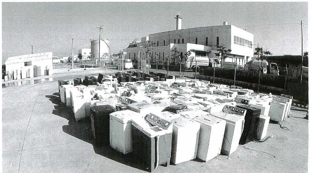
4月から家電リサイクル法の対象になるテレビや洗濯機などの家電品（市衛生処理場）

平成十年に制定された「家電リサイクル法」は、特定家電品に含まれる資源物を有効利用し、環境問題の改善を図るためにつくられたものです。この法律に基づき、消費者、小売業者、製造業者が協