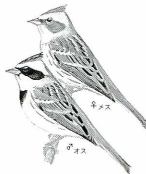
西日本に多く渡ってくるミヤマホオジロ

冬を過ごす間、オスもメスもそれぞれに自分の食べ物を維持するなわばりを持つています。春になれば結婚するかもしれないもの同士でも、冬はお互いに容赦なし。鏡に映った自分の姿でさえ激しくライバル視するほど