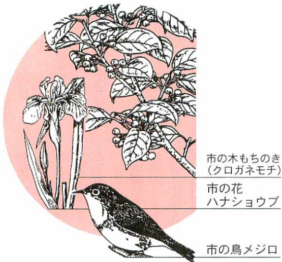
市の木もちのき（クロガネモチ） 市の花 ハナショウブ 市の鳥メジロ