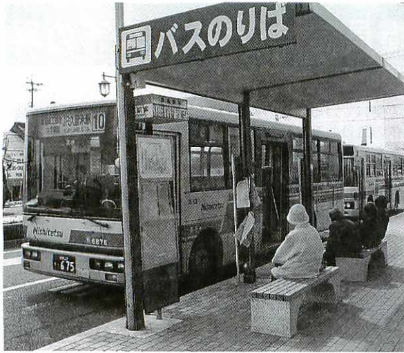
存続が決まり、4月から鳥栖交通が運行することになった広域路線バス