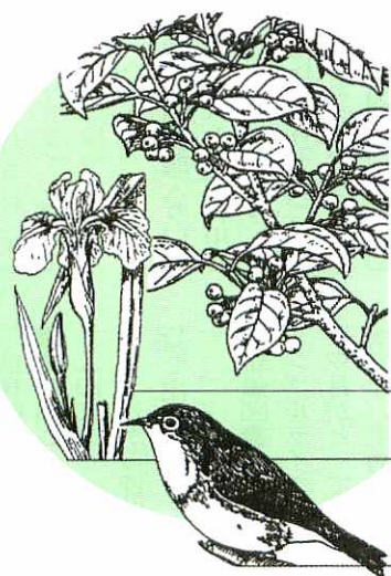
市の木もちのき(クロガネモチ)

鳥栖市管工事協同組合 ☎84-2500 ● 水道の修繕はすべて上記へお申し込みください