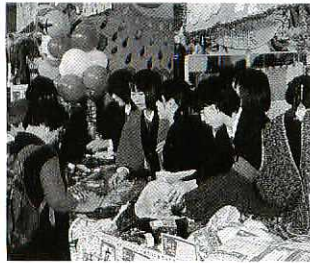
昨年の鳥栖商デパート風景