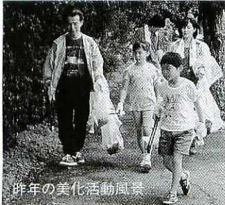
昨年の美化活動風景

県下一斉「ふるさと美化活動」の一つとして、市と市環境保全協議会では、空き缶の回収活動を行います。市民のみなさんの多数のご参加をお願いします。 詳しくは生活環境課公害交通係（☎85・3577）へ。 とき●6月3日（日）午前8時40分（雨天のときは6月10日（日）に延期） ところ●市役所前広場集合 内容●佐賀競馬場から市役所までの国道34号沿いに散乱している空き缶などを回収します（道具は主催者で準備します）