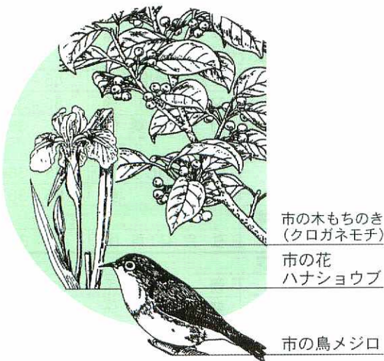
市の木のモチノキ (クログネモチ)

平成12年度で新たに左図のとおり本鳥栖町や古賀町、曾根崎町、原町などで下水道の供用を開始。今年3月末現在、市内の1247・2ヘクタールの区域で下水道が利用できるようにになりました。 多くの経費を投じて整備された下水道の効果を發揮するため、速やかに水洗化工事をしてください。また、市民のみなさんには下水道工事などでご迷惑をおかけしますが、ご協力いただきますようお願いいたします。詳しくは下水道課(☎85・3542)へ。