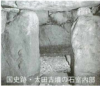
国史跡・太田古墳の石室内部

定員●120人（先着順） 申し込み●12月7日まで に、電話で教育委員会生涯学習課文化財係（☎85・3695）へ。