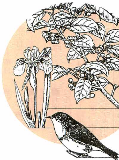
市の木もちのき (クロガネモチ) 市の花 ハナショウブ