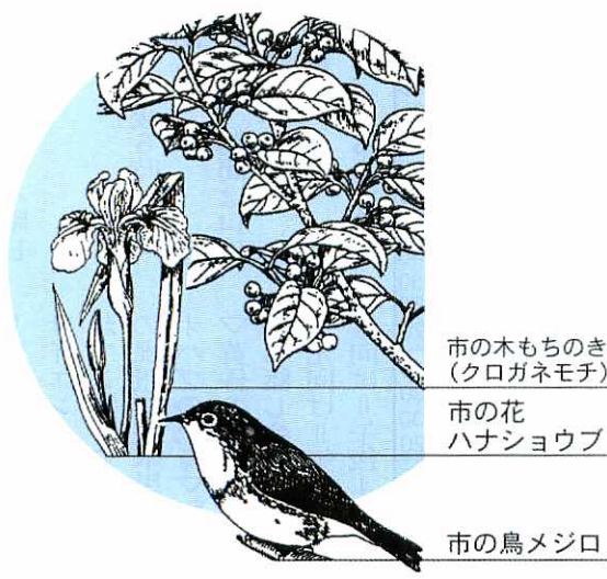
市の木もちのき(クロガネモチ) 市の花 ハナショウブ 市の鳥メジロ