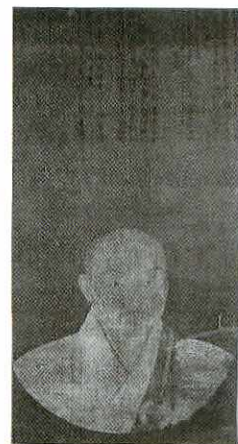
絹本着色見心来復像(萬歳寺所蔵)

2年がかりで修復した萬歳寺(河内町)所蔵の絵画2点(絹本着色見心来復像)「絹本墨画淡彩以亨得謙像」