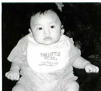
龍大介さん幸さんの長男