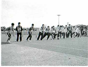
一斉にスタートする選手たち

「第18回鳥栖市子どもクラブ連絡協議会駅伝大会」が12月8日、市陸上競技場で開かれました。15チームが参加し、13区間で熱戦を展開。結果は次のとおりです。(○内は区間、敬称略)