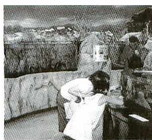
筑後川流域を再現した水槽を眺める来館者

開館時間 午前9時半～午後5時 休館日 毎週月曜日(ただし月曜日が祝日の場合は開館し、翌日火曜日に休館)、年末年始(12月29日から1月3日) 入館料 無料 問い合わせ 筑後川発見館「くるめウス」(☎45・5042)