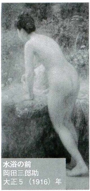
水浴の前 岡田三郎助 大正5(1916)年

「アカデミズムの潮流」とき 10月24日から11月24日まで、午前10時〜午後6時(会期中は無休) ところ 県立美術館(佐賀市) 観覧料 大人620円(20人以上の団体は510円)、大学生300円(同200円)。高校生以下は無料 展示内容 佐賀県出身の画家たちが目覚ましい活躍を