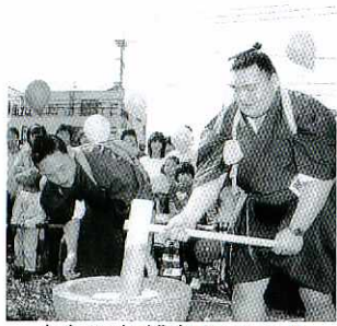
去年の相撲部屋まつり

鳥栖市商店街連合会では、大相撲桐山部屋の力士らを招いて相撲部屋まつりを開きます。 詳しくは同まつり事務局 (☎83・3121) へ。 とき 10月25日(土)午後1時~同3時半 ところ 大正町商店街(中央公園西側) 内容 ちゃんこ鍋の配布、もちつき大会、クイズ、お楽しみ抽選会、力士との写真撮影ほか