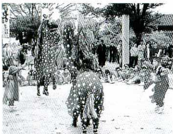
雌雄両獅子が舞う藤木の獅子舞