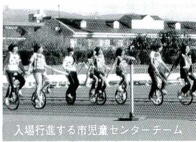
入場行進する市児童センターチーム

「第5回さわやか佐賀県一輪車競技大会」が11月23日、県総合運動場で開かれ、市内からは市児童センターチーム67人が出場しました。結果は次のとおりです。