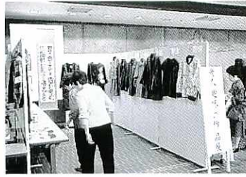
昨年の「老人趣味の作品展」

市制50周年記念事業「とす50祭」の一環として、第20回市民健康福祉まつりを9月19日(日)、サンメッセ鳥栖周辺で開きます。同まつりは、市民が健康